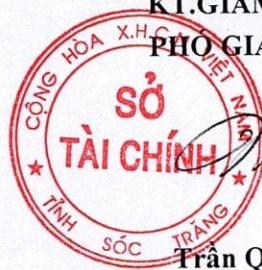
Trần Quốc Sở